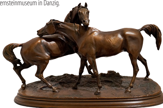
Pierre-Jules Mêne, Arcolade-Cheveaux Arabes, Die Umarmung, 1865 © Michael Imhof Verlag

Das Westpreußische Landesmuseum präsentiert eine Doppelausstellung des Kulturzentrums Ostpreußen zum Thema Trakehner. Der erste Ausstellungsteil widmet sich der Entstehung und Entwicklung des Landgestüts Trakehnen sowie der Bedeutung dieser edlen Pferderasse, die zu einem Synonym für Leistungsfähigkeit und Eleganz im ostmitteleuropäischen Raum wurde. Der zweite Teil der Ausstellung – Die Flucht der Trakehner – beleuchtet das Schicksal der Pferde und ihrer Züchter während und nach dem Zweiten Weltkrieg. In diesem Kontext wurden die Trakehner zu einem Symbol für Verlust, Neuanfang und kulturelle Identität. Zu sehen sind u. a. Objekte, Fotografien und Gemälde aus dem Westpreußischen Landesmuseum, dem Kulturzentrum Ostpreußen in Ellingen und dem Bernsteinmuseum in Danzig.