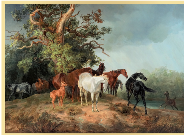
Albrecht Adam, Weidende Pferde vor einem Gewitter, 1841 © Michael Imhof Verlag

Zum 200-jährigen Jubiläum des NRW-Landgestüts Warendorf präsentiert das Dezentrale Stadtmuseum eine Ausstellung mit Pferdedarstellungen des 19. Jahrhunderts. Trotz Industrialisierung und Maschinen bleibt das Pferd ein wichtiges Statussymbol und Motiv in der Kunst. Porträts, Gesellschafts-, Genre- und Jagdszenen dokumentieren die weiterhin andauernde künstlerische Auseinandersetzung mit dem Pferd als Bildmotiv in den unterschiedlichsten Kontexten und Zusammenhängen. Einige Maler spezialisieren sich auf das Motiv, genießen große Anerkennung bei Adel und Großbürgertum und finden auf dem Kunstmarkt weite Verbreitung.