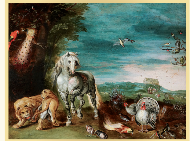
Werkstatt des Jan Brueghel, Paradieslandschaft mit dem Auszug der Arche Noah, o. D.

Die Ausstellung im Westfälischen Pferdemuseum zeigt, wie sich das Bildmotiv Pferd in dem Zeitraum vom 16. bis zum 18. Jahrhundert in der europäischen Kunst entwickelte. So avancierte das Pferd im 17. und 18. Jahrhundert vom Symbol der Macht, militärischer Stärke und sozialem Status hin zum eigenständigen, charaktervollen Individuum in seiner natürlichen Umgebung. Bedeutende Exponate – Gemälde, Grafiken und Skulpturen – dokumentieren die Entwicklung in der Renaissance und des Barocks.