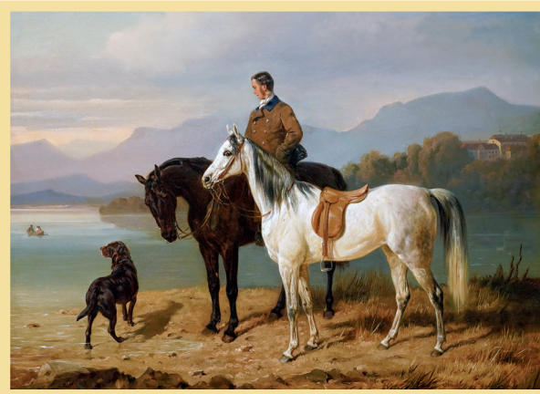
Franz Adam, Chiemseelandschaft mit Reiter, um 1850

Mensch und Pferd verbindet eine jahrtausendealte Beziehung. Zeichnungen von Pferden als künstlerischer Ausdruck dieser Verbindung finden sich bereits in den steinzeitlichen Höhlenmalereien. Über alle Epochen der Menschheitsgeschichte hinweg hat das Pferd in seinen unterschiedlichen Nutzungsmöglichkeiten durch den Menschen – als Transportmittel, in der Landwirtschaft, im Krieg oder beim Reitsport – oder auch in seinem natürlichen Lebensraum als Wildpferd Eingang in die Kunst gefunden. Ob als Steinskulptur oder Bronzeplastik, als Ölgemälde oder Lithografie, als Federzeichnung oder Buchmalerei – das Pferd begleitete und faszinierte den Menschen in seinem Kunstschaffen ebenso wie in seinem alltäglichen Leben und Arbeiten.